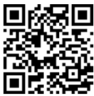
ZX10 3D demo